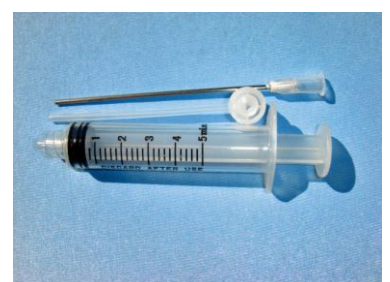
小分け注射器 1~5ml 300 円税別