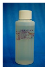
キトサンジェル原液 100ml ¥1,000 円税別